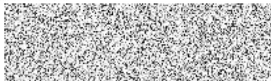
oprávněná úřední osoba